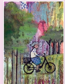
IMMAGINE A CURA DI ART DEPARTMENT SIGG

L'attestato di partecipazione verrà inviato via mail al termine del Congresso.