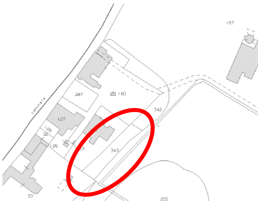
estratto di mappa – fuori scala