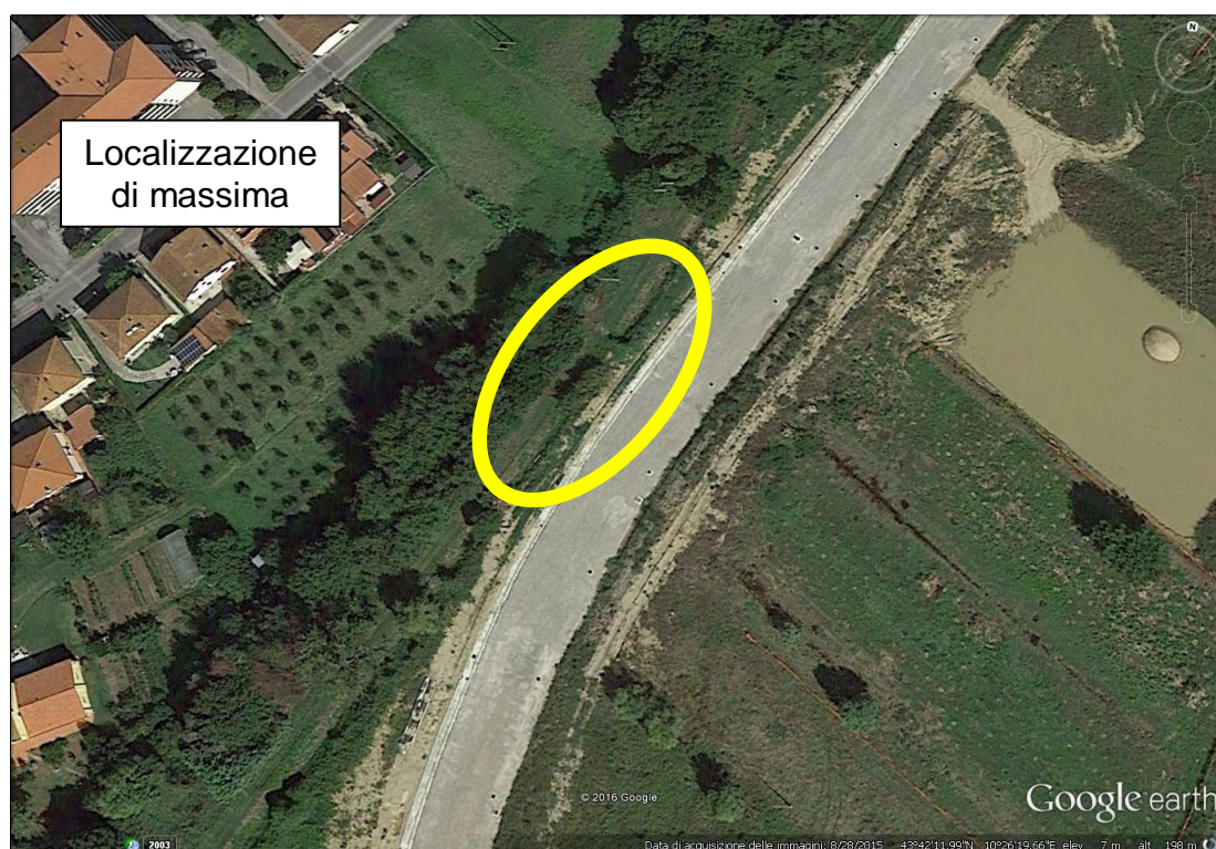
Quadro normativo vigente